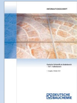
Informationsschrift „Elastische Dichtstoffe im Bodenbereich – Teil 1: Außenbereich“

» https://deutsche-bauchemie.de/publikationen/deutschsprachige-publikationen