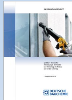
Informationsschrift „Spritzbare Dichtstoffe – Anwendung in der Fenster- und Türmontage im Neubau und bei der Sanierung“