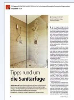
„Tipps rund um die Sanitärgefuge“