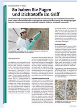
„So haben Sie Fugen und Dichtstoffe im Griff“