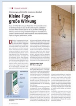
„Kleine Fuge, große Wirkung – Anforderungen an Dichtstoffe im modernen Gästebad“

Die vielfältigen Anwendungsgebiete von Baudichtstoffen werden thematisiert und durch Erarbeitung zahlreicher Fachartikel für die Veröffentlichung in der Fachpresse aufbereitet.