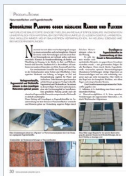
„Sorgfältige Planung gegen hässliche Ränder und Flecken“