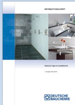
Informationsschrift „Elastische Fugen im Sanitärbereich“