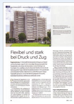
„Flexibel und stark bei Druck und Zug“