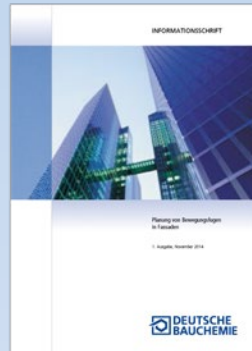
Informationsschrift „Planung von Bewegungsfugen in Fassaden“