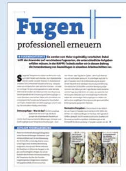
„Fugen professionell erneuern“