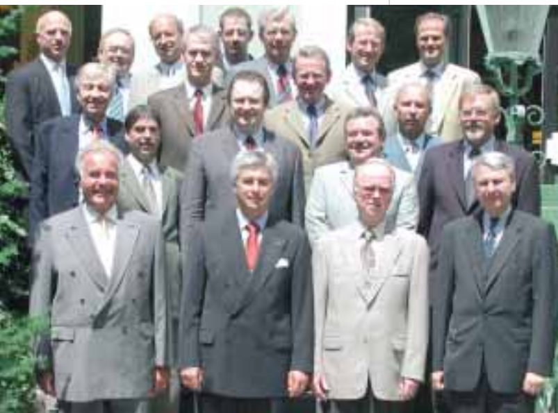
Vorstand und Obleute der Fachausschüsse in Bad Reichenhall.

Die Vortragsveranstaltung zur Jahrestagung beschäftigte sich mit folgenden Themen: