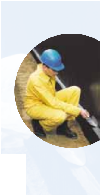
Fachausschuss 5 „Kunststoffe im Betonbau“

möglicher Gesundheitsgefahren durch Bitumen bzw. Dämpfen und Aerosolen aus Bitumen durchgeführt werden. Die Kernuntersuchung – eine Langzeitinhalations-Tierstudie – startete nach intensiven und langwierigen Vorarbeiten Anfang des 2. Quartals 2003 am Fraunhofer-Institut für Toxikologie und Aerosolforschung in Hannover. Ergebnisse dieser weltweit mit großem Interesse verfolgten Studie werden voraussichtlich im 2. Halbjahr 2005 vorliegen.